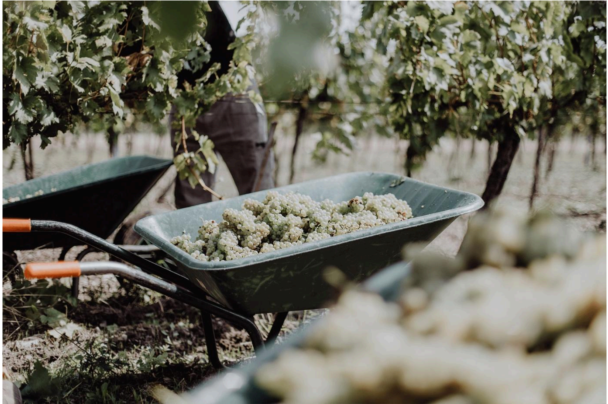
(Weingut Martin Pasler, Jois-Neusiedlersee)