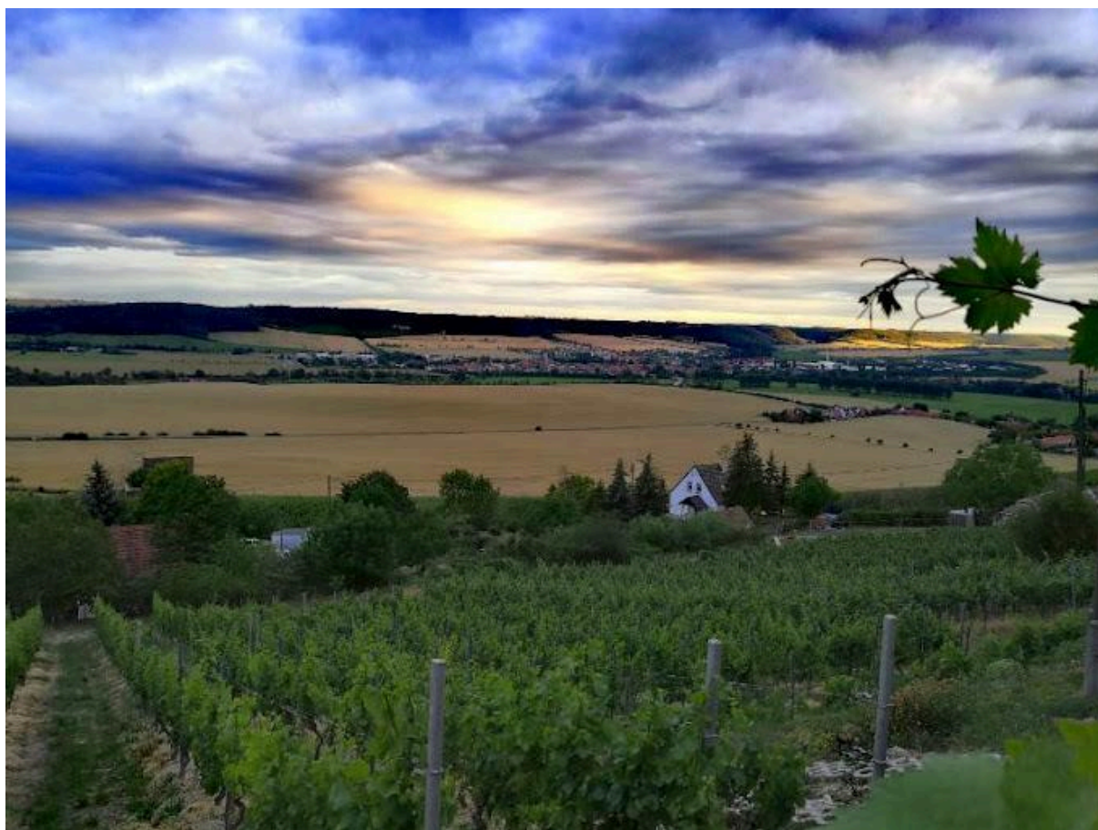
(Weingut Beyer, Laucha an der Unstrut)