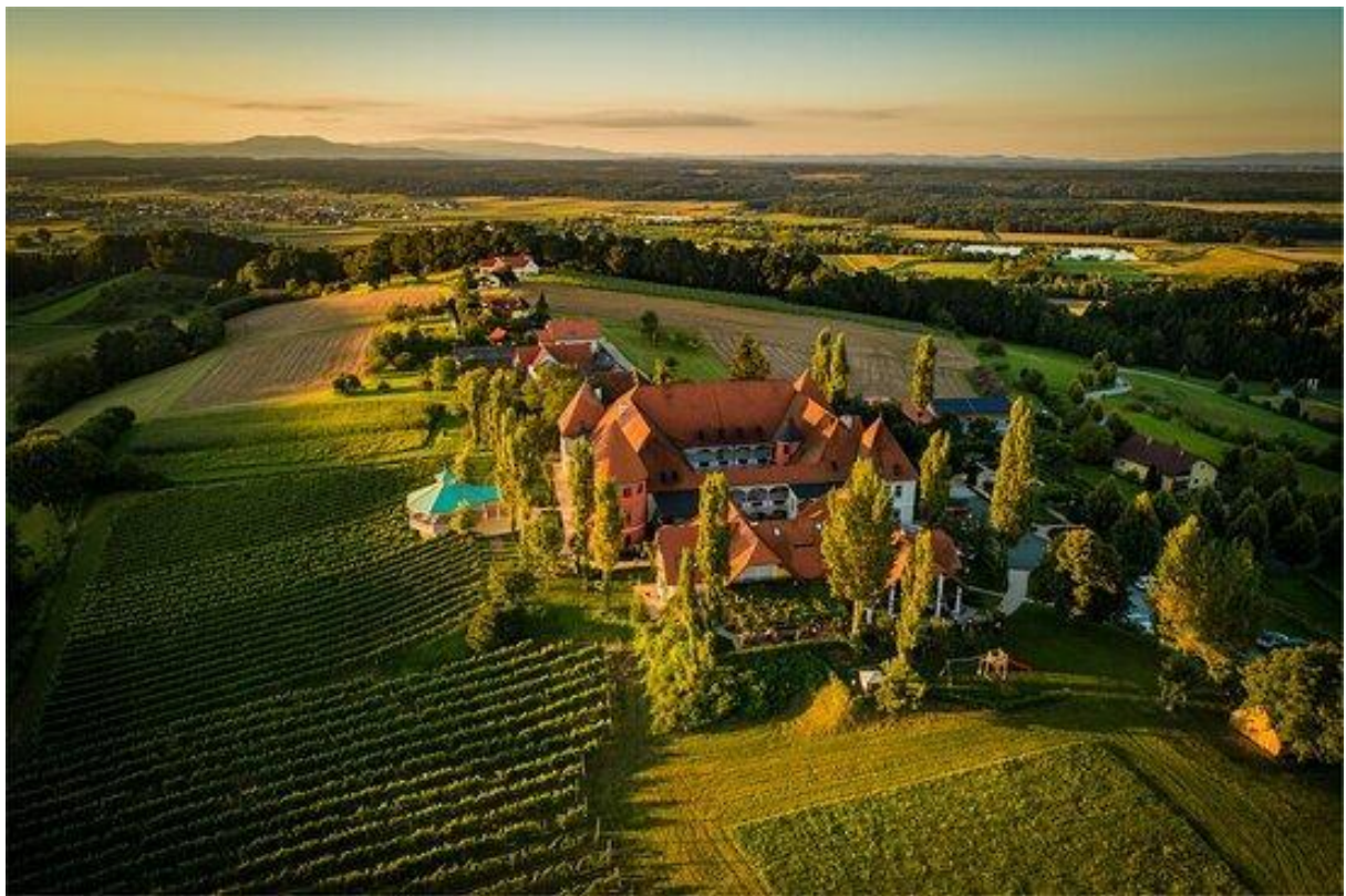
(Weinschloß Koarl Thaller, Maierhofbergen, Vulkanland Steiermark)