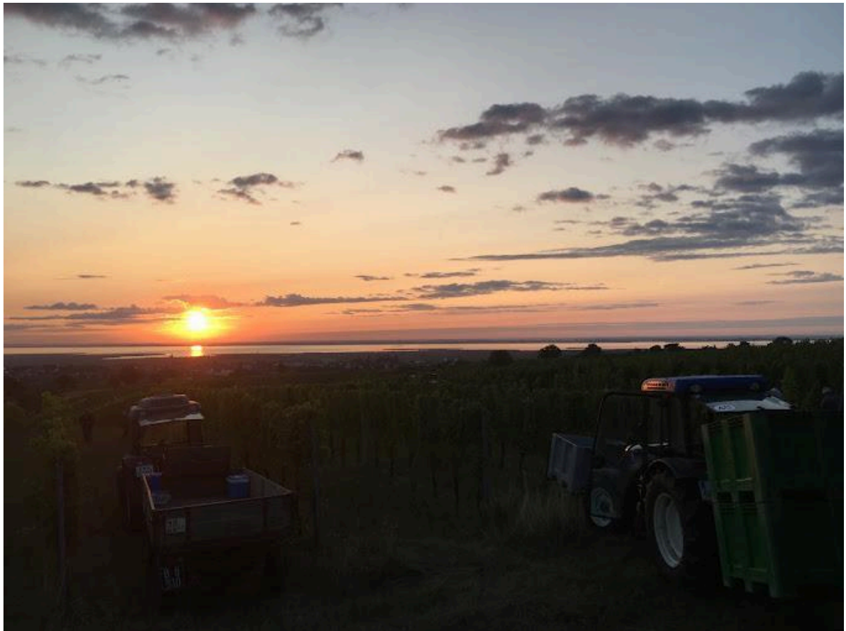
(Weingut Kraft, Rust - Neusiedlersee)